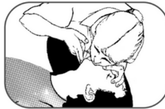
انجام تنفس مصنوعی

در صورت نیاز به تمدید نسخه تماس بگیرید، پیامک بفرستید یا نقشه را مخابره کنید. اگر نالوکسان خود را مصرف کرده‌اید، به ما اطلاع دهید.